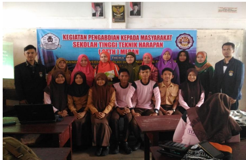
Gambar 2. Kegiatan Pengabdian