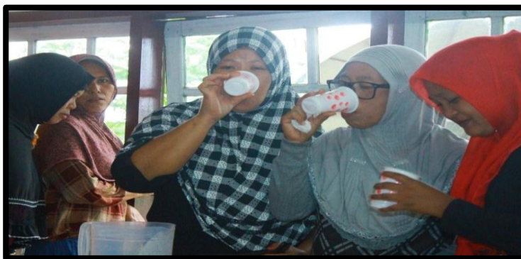
Gambar 10 : Penggunaan jamu instan oleh ibu-ibu rumah tangga dan peserta KKS