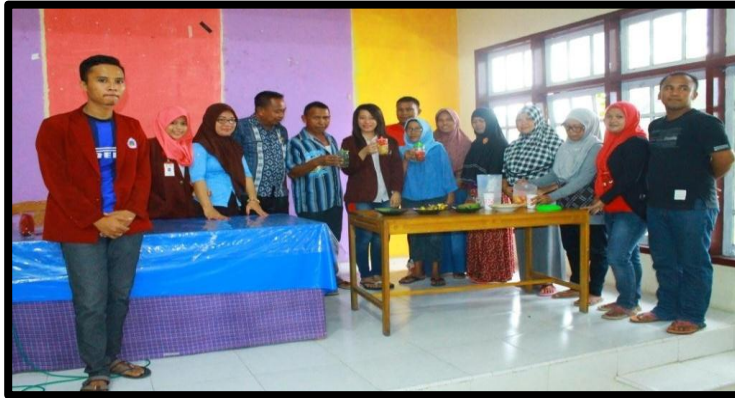
Gambar 10 : Pembinaan dan pelatihan TOGA kepada warga masyarakat Sampurtoba