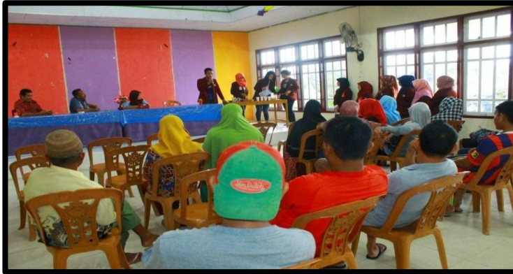
Gambar 7. Pembuatan jamu instan Tanaman Obat Keluarga Oleh Peserta KKS