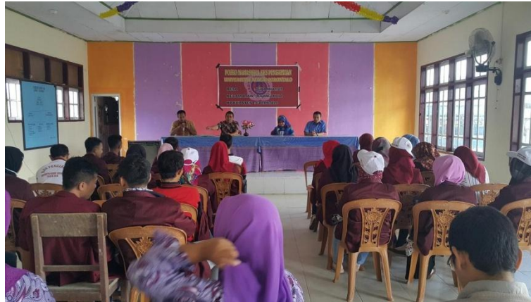
Gambar 2. acara sosialisasi Program Pengabdian dari Dosen Pembimbing Lapangan kepada Kepala desa Sampurtoba