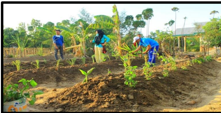
Gambar 6 : pengolahan dan Pemeliharaan Tanaman Obat Keluarga

Pengolahan tanaman obat keluarga dilakukan oleh kelompok ibu rumah tangga beserta KKS. Pengolahan tersebut sekaligus pemeliharaan guna keberlangsungan pemanfaatan tanaman obat oleh masyarakat dalam waktu yang lama, dan tidak hanya sekedar tanaman hias melainkan sebagai kebutuhan dalam pengobatan alternative mengingat obat modern semakin mahal.