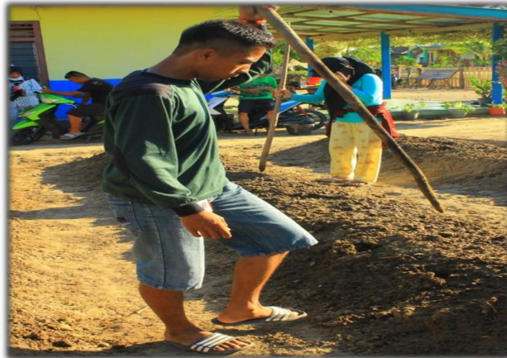
Gambar 5. Penanaman Tanaman Obat Keluarga