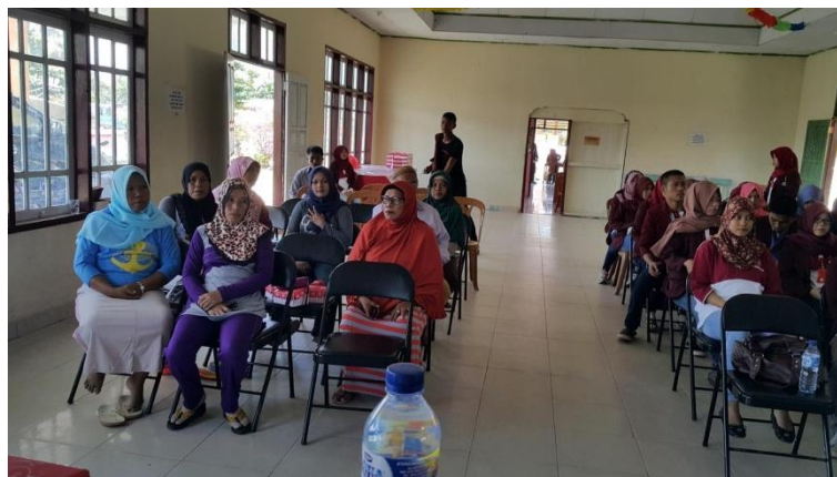
Gambar 3 : penyuluhan oleh DPL dan penyuluh pertanian kepada peserta ibu-ibu rumah tangga dengan program TOGA

Pembuatan lahan tanaman obat keluarga dilakukan di empat dusun yang ada di desa sampurtoba yang di hadiri oleh masyarakat dan peserta KKS, sebelum pembuatan lahan tersebut dosen pembimbing lapangan mengundang nara sumber dari penyuluh pertanian yang ada di kecamatan Hariang dengan isi penyuluhan yaitu bagaimana cara pembuatan lahan pekarangan dan membudidayakan berbagai tanaman obat maupun sayur yang ada di dalam lahan tersebut.