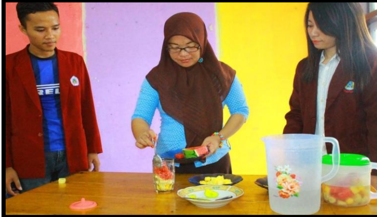
Gambar 9 : Cara Pengolahan dan pembuatan yang di lakukan oleh peserta KKS dan ibu-ibu rumah tangga