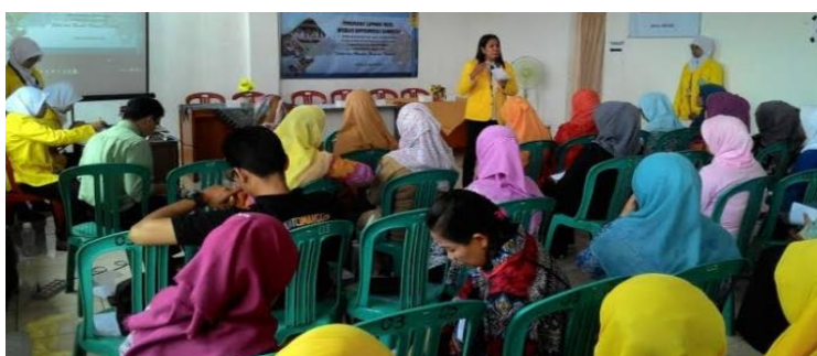
Gambar 1. Sosialisasi alat dan monitoring