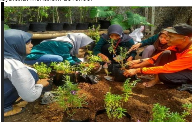
Gambar 2. Sosialisasi dan diskusi cara merawat tanaman levender