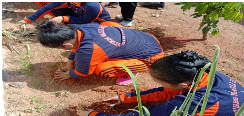
Gambar 3. Penanaman bunga levender