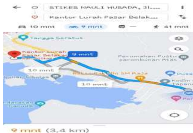
Gambar 1. Maps Lokasi

Lokasi Kegiatan Pengabdian Masyarakat ini di laksanakan di Kelurahan Pasar Belakang tepatnya di kantor lurah pasar belakang yang teletak di sibolga kota, Sibolga, Sumatera Utara, Indonesia. Jarak perguruan tinggi ke kantor lurah pasar belakang dapat di tempuh selama 9 menit.