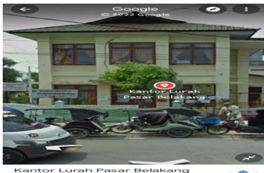
Gambar 2. Lokasi Pengabdian

Peta Lokasi jarak perguruan tinggi STIKes Nauli Husada Sibolga dengan kantor lurah pasar belakang tempat pengabdian masyarakat di tempuh selama 9 menit dari perguruan tinggi ke tempat tujuan.