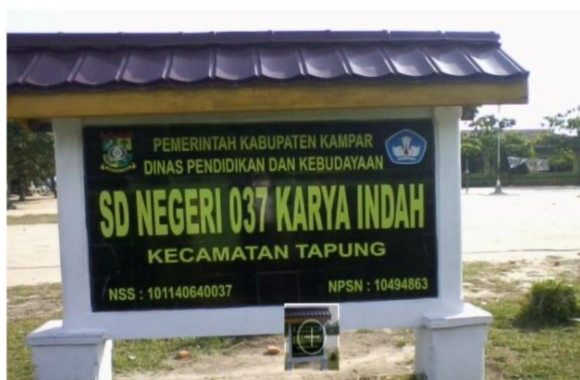
Gambar 2. Lokasi Pengabdian