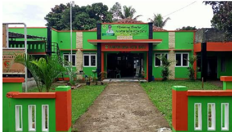
Gambar 2. Lokasi Kegiatan Kantor Desa Kota Batu