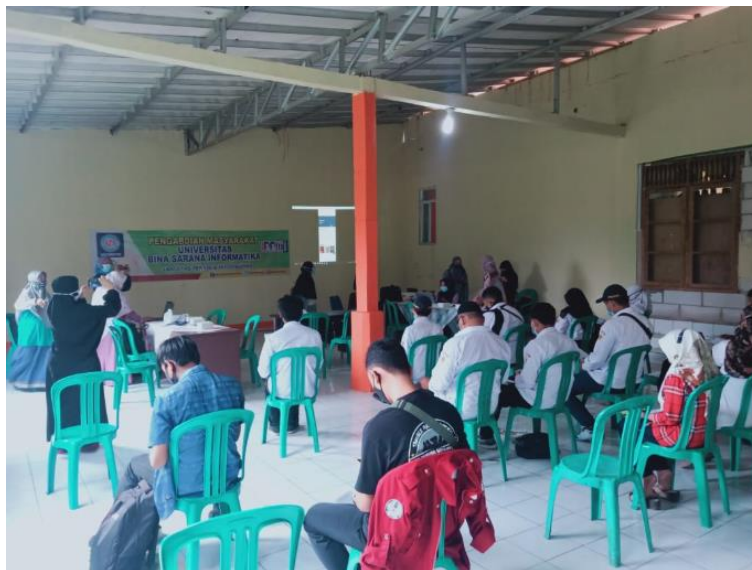
Gambar 4. Peserta Melakukan Tanya Jawab

Pelatihan pengolahan angka dengan Microsoft Excel terdiri dari penjelasan fungsi Small dan Large, Average, Averageif, averageifs, Count, SUM, Vlookup dan Hlookup.