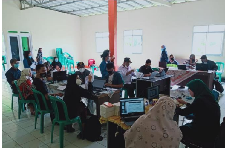
Gambar 3. Kegiatan Pelatihan

Pengolahan Angka dengan Microsoft Excel dipilih sebagai bahan pelatihan bagi Staff Kantor Desa Kota Batu Bogor. Tujuan kegiatan adalah untuk menambah ilmu pengetahuan staff Kantor Desa Kota Batu Bogor di bidang teknologi yaitu Penggunaan Microsoft Excel Sebagai penunjang kegiatan sehari-hari dalam administrasi dan pelayanan terhadap warga masyarakat.