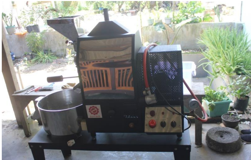
Gambar 4. Mesin Roasting yang D hibahkan

Dengan adanya peralatan Mesin Roasting yang dihibahkan, yaitu yang bersifat modern dan dapat memproduksi dalam jumlah relatif besar, maka mitra dapat memanfaatkan mesin tersebut untuk menghasilkan produksi kopi yang lebih besar, yaitu dengan kapasitas 2 kg olahan kopi yang dihasilkan.