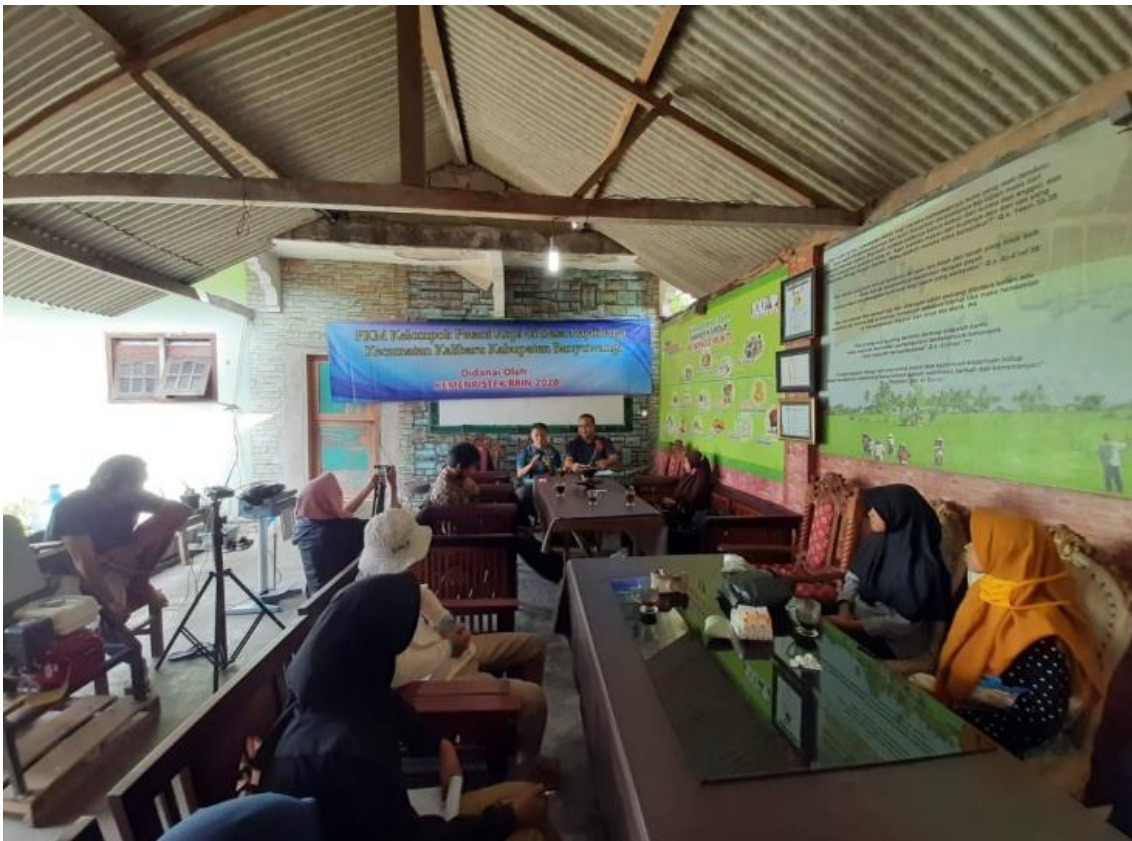
Gambar 2. Lokasi Pengabdian