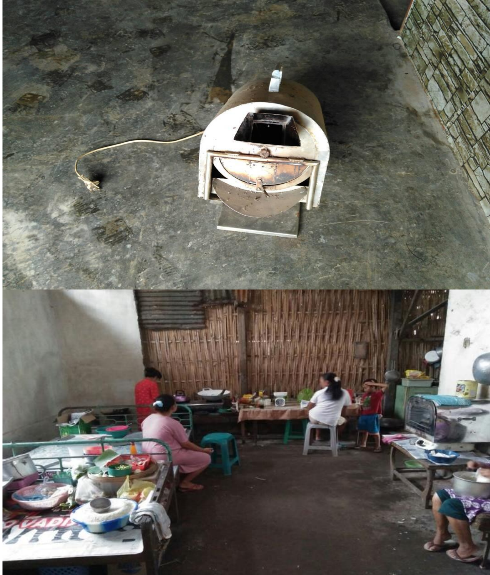
Gambar 3. Peralatan Sederhana dalam Mengolah Kopi

Untuk mengatasi permasalahan mitra terkait keterbatasan jumlah produksi kopi yang dihasilkan, hal ini dikarenakan mitra masih menggunakan peralatan yang bersifat sederhana dalam mengolah kopi, yaitu dalam bentuk mesin roasting sederhana dan menggunakan wajan dalam pengolahan. Sehingga hal tersebut menyebabkan tidak maksimalnya jumlah produksi kopi yang dihasilkan. Berikut adalah peralatan yang digunakan oleh mitra dalam mengolah kopi :