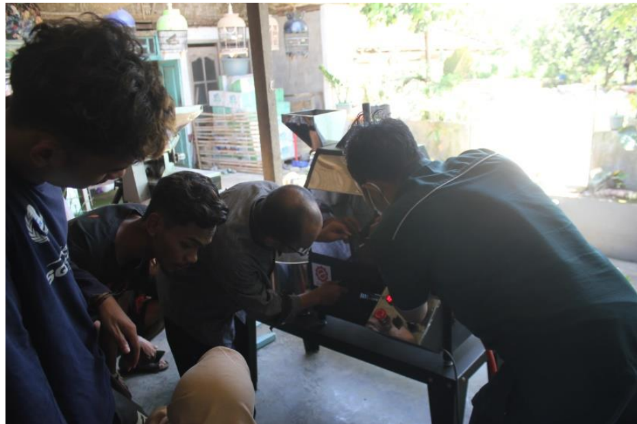
Gambar 5. Pelatihan Pengolahan Kopi