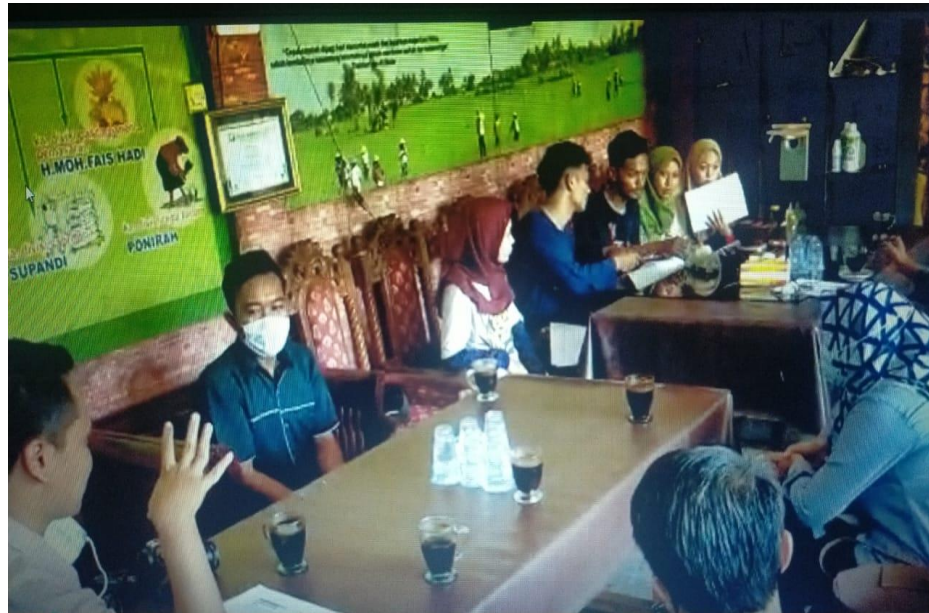
Gambar 8. Pelatihan Pengelolaan Keuangan

Berikut adalah gambaran pada saat dilakukan pelatihan pengelolaan keuangan :