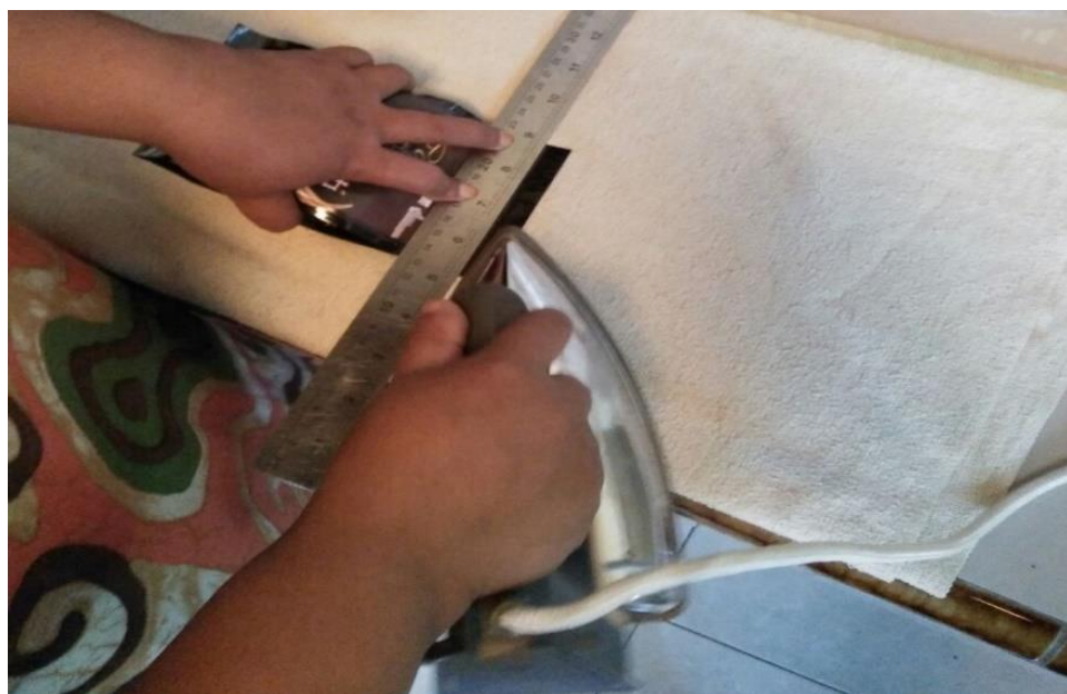
Gambar 6. Pengemasan menggunakan Seterika dan Penggaris

Pengemasan merupakan salah satu tahap akhir dalam proses produksi kopi. Kegiatan pengolahan melibatkan sumberdaya manusia yang terampil dalam melakukan pengemasan secara baik dan rapi. Selain itu juga dibutuhkan peralatan yang memadai agar pengemasan yang dilakukan menghasilkan kemasan yang baik dan rapi. Selama ini, mitra mengalami kendala dalam pengemasan yaitu pengemasan masih bersifat sederhana yaitu menggunakan seterika dan penggaris untuk merekatkan kemasan. Sehingga dirasa tidak efektif serta memakan waktu yang lumayan lama. Berikut adalah alat pengemasan lama yang dimiliki oleh mitra :