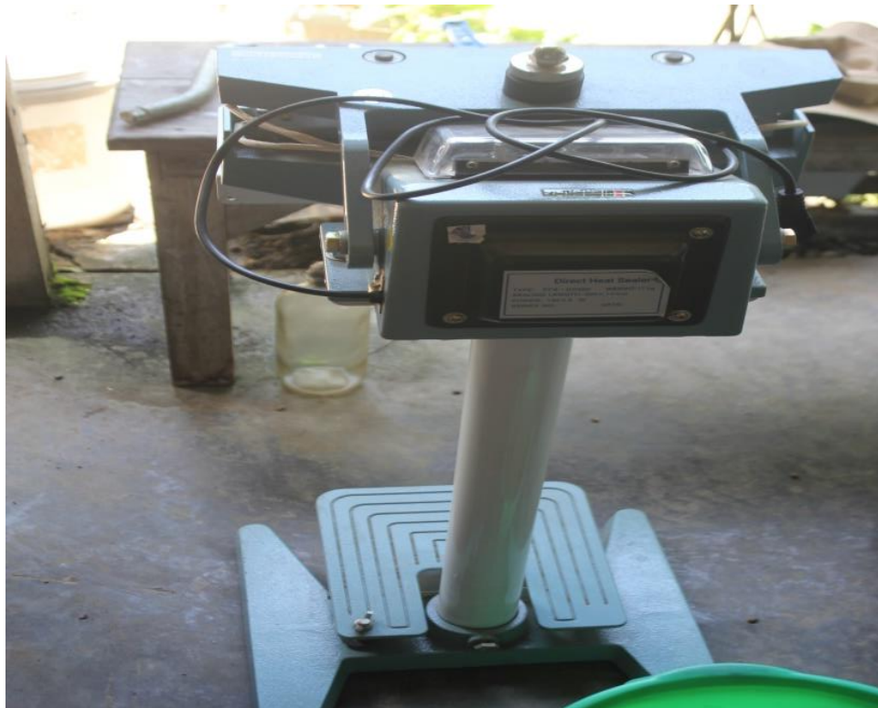
Gambar 7. Mesin Sealer

Oleh karena itu, Tim PKM memutuskan untuk memberikan hibah mesin sealer agar pengemasan yang dilakukan oleh mitra menjadi lebih cepat, rapi, dan baik. Berikut adalah mesin sealer yang dihibahkan oleh Tim PKM :